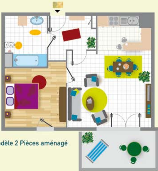
Modèle 2 Pièces aménagé