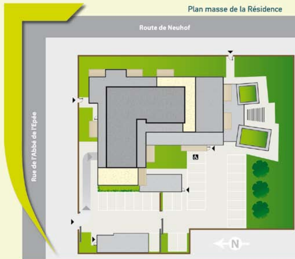
Plan masse de la Résidence