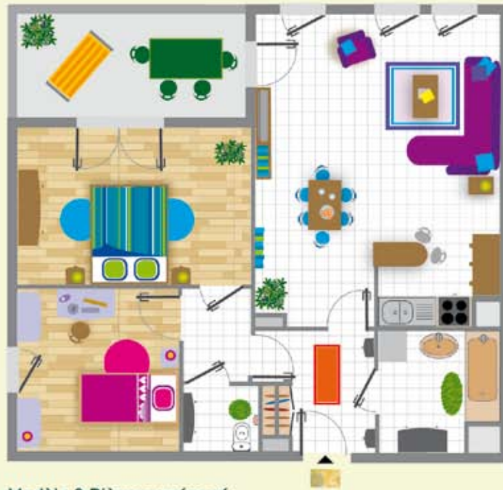
Modèle 3 Pièces aménagé