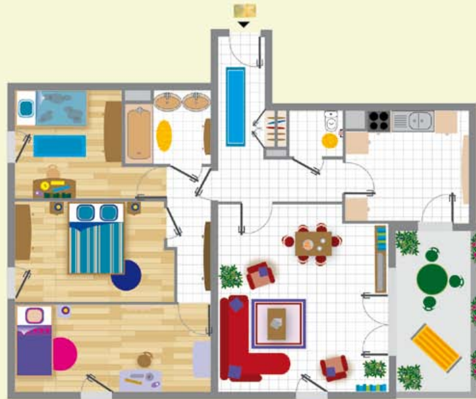
Modèle 4 Pièces aménagé